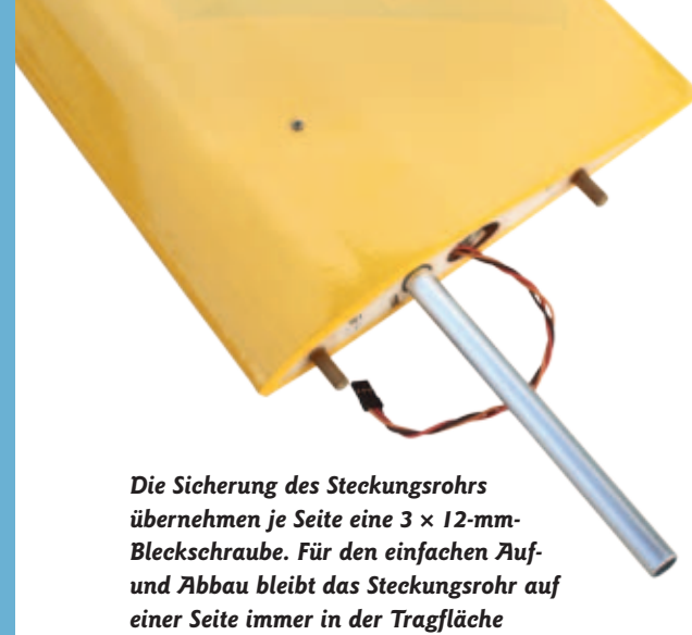
Die Sicherung des Steckungsrohrs übernehmen je Seite eine 3 x 12-mm-Blechschräube. Für den einfachen Auf- und Abbau bleibt das Steckungsrohr auf einer Seite immer in der Tragfläche