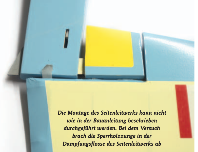
Die Montage des Seitenleitwerks kann nicht wie in der Bauanleitung beschrieben durchgeführt werden. Bei dem Versuch brach die Sperrholzleiste in der Dämpfungsflosse des Seitenleitwerks ab