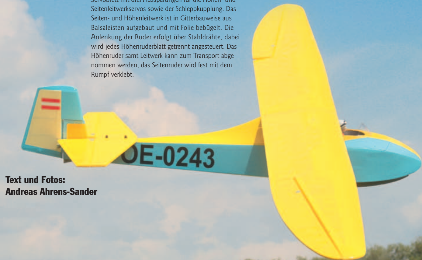
Text und Fotos: Andreas Ahrens-Sander

Beginnen wir mit der Fertigstellung der Tragflächen, hier sind die Servos zur Anlenkung der Querruder zu montieren. Was keine Probleme bereitet, da diese lediglich mit den Halteklötzen auf dem Deckel der Abdeckung verschraubt werden müssen. Das Ruderhorn wird mit dem Querruder verschraubt, ein kurzes Gestänge übernimmt die Verbindung zum Servo. Nach dem Einziehen der Servoverlängerungskabel müssen noch in jede Wurzelrippe zwei Buchenrundhölzer als Verdrehsicherung eingeklebt werden.