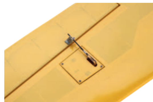
Die fertige Querruderanlenkung mit dem Rudergestänge und dem Ruderhorn. Alle benötigten Teile liegen dem Bausatz bei

Alle Scharniere an den Querrudern sind bereits befestigt, sollten jedoch zur Sicherheit kontrolliert werden. Die Steckung der Tragfläche wird mit einem 12 Millimeter (mm) großen Aluminiumrohr durchgeführt. Die Sicherung der Tragflächen am Rumpf übernimmt je Seite eine 3 x 12-mm-Blechschräube, die von oben in das Alurohr geschraubt wird. Das Loch in der Tragflächenoberseite ist schon vorbereitet, es muss noch mit einem 2-mm-Bohrer in die Steckung gebohrt werden. Damit man auf dem Flugfeld nicht immer die Löcher wieder suchen muss, empfiehlt es sich, das Alu-Rohr auf einer Seite in der Tragfläche zu belassen. Die typischen Flächenstreben des Grunau Babys werden durch Magnete an Rumpf und Tragfläche gehalten. An jeder Strebe ist auf einer Seite